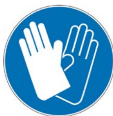
Protection obligatoire des mains.