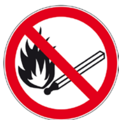
Flamme nue interdite. Défense de fumer.

Lorsque vous êtes dans la menuiserie et dans les locaux de stockage, vous devez appliquer certaines règles, suivre les indications des panneaux d'affichage (interdictions et obligations) ainsi que toutes les informations visuelles présentes sur le site.