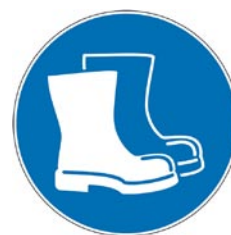
Protection obligatoire des pieds.