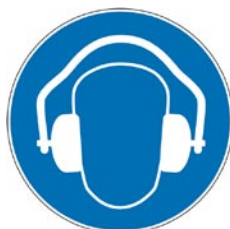
Protection obligatoire de l'ouïe.