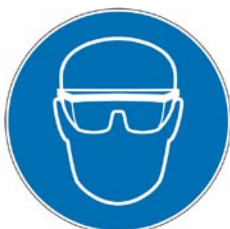
Protection obligatoire de la vue.