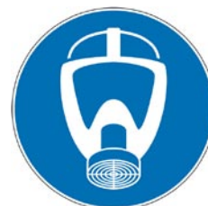
Protection obligatoire des voies respiratoires.