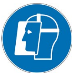
Protection obligatoire du visage.